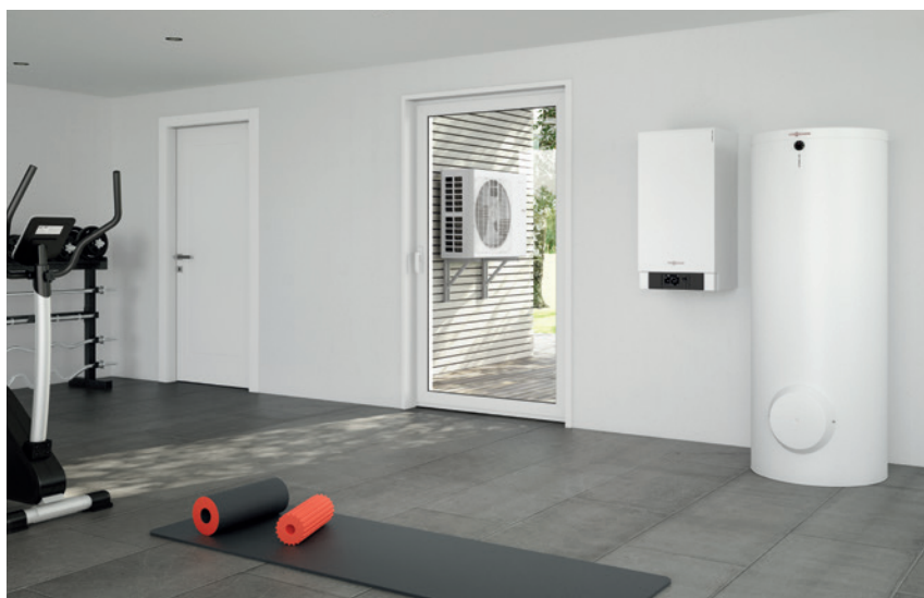
Сплит тепловой насос воздух-вода Vitocal 100-S (внутренний блок), накопительный водонагреватель Vitoscell (справа) и внешний блок

Тепловые насосы сплит с привычно высоким качеством сборки и уровнем эффективности от Viessmann по привлекательной цене