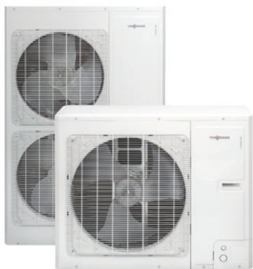
Наружные блоки для Vitocal 100-S