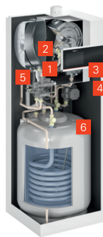
Vitodens 222-F с эмалированным трубчато-спиральным емкостным водонагревателем (тип B2SE)