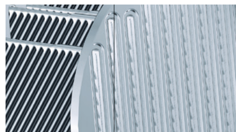
Теплообменная поверхность Inox-Crossal для обеспечения высокоэффективной теплопередачи и высокой скорости процесса конденсации.

Высокая эффективность теплопередачи и высокая скорость конденсации обеспечивают КПД до 98 процентов ( \eta_s ). Эти значения достигаются за счет противотока продуктов сгорания и котловой воды, а также интенсивного закручивания нагревательных газов через поверхность нагрева.