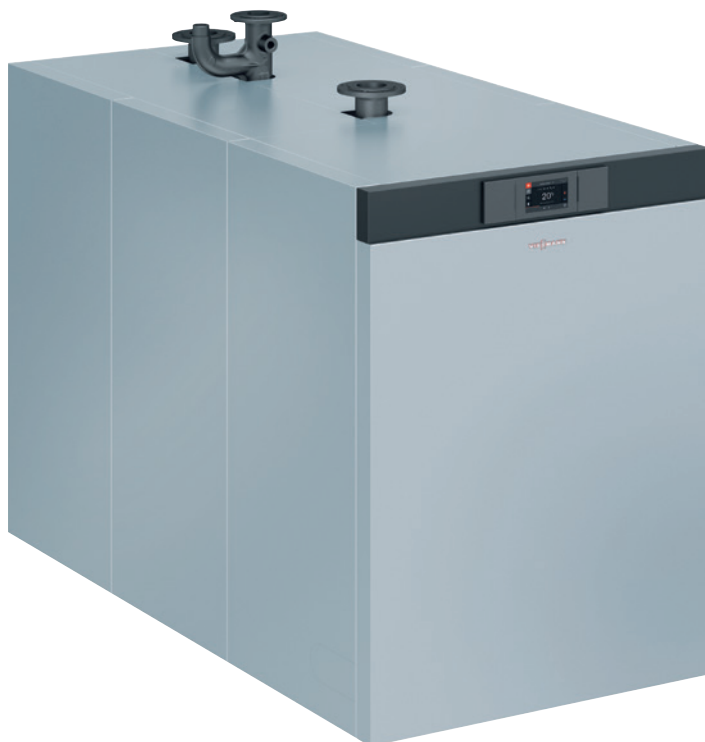
Vitocrossal 200 – Газовый конденсационный котел с номинальной тепловой мощностью от 87 до 311 кВт

Газовый конденсационный котел Vitocrossal 200 (тип CM2C) мощностью от 87 до 311 кВт задает новые масштабы в модульном исполнении. Благодаря применению хорошо зарекомендовавшей себя цилиндрической горелки MatriX становится возможной эксплуатация на газе типа E, L, LL, при мощности от 186 кВт – также и на сжиженном, а кроме того, модуляция до 20 %.