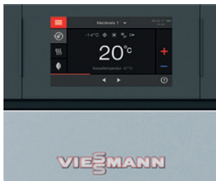
Vitotronic 200 - встроенный контроллер для модулей отопительных котлов

Vitocrossal 200 идеально подходит для установки в котельных многоквартирных домов и на промышленных предприятиях. Каскадная установка может состоять максимум из 8 котлов. Для установок из двух котлов компания Viessmann поставляет готовые к монтажу системные трубные обвязки и выпускные коллекторы из высококачественной нержавеющей стали. Отопительная установка оснащена надежными компонентами газового конденсационного оборудования компании Viessmann, такими как теплообменные поверхности Inox-Crossal и цилиндрические горелки MatriX или ИК-горелки MatriX. Отопительный котел может эксплуатироваться с выбором режима работы: возможна работа с забором воздуха для горения из помещения котельной, а также извне.