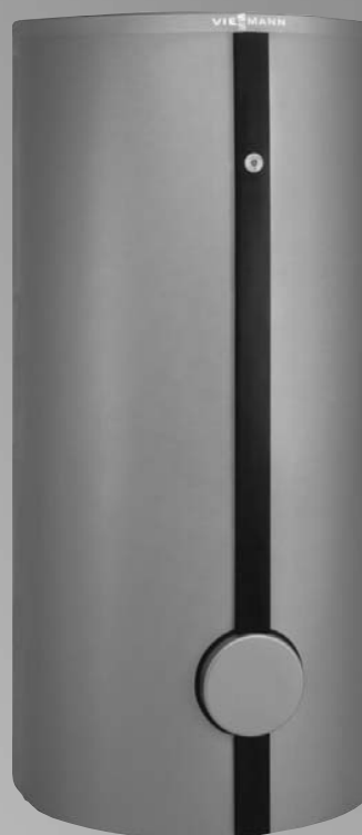
Vitocell 100-V объем от 500 литров (500 литров с термометром, принадлежность)