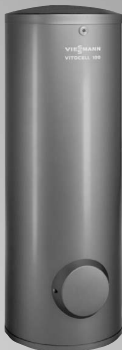
Vitocell 100-V объем до 300 литров (160 и 200 литров без фланцевого отверстия)